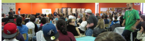
Rencontre privilège avec plus de 140 étudiants du Centre de formation professionnelle (CFP) Formation générale