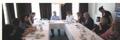
Dîner privilège avec trois entrepreneurs de la brigade et six étudiantes de la Formation professionnelle