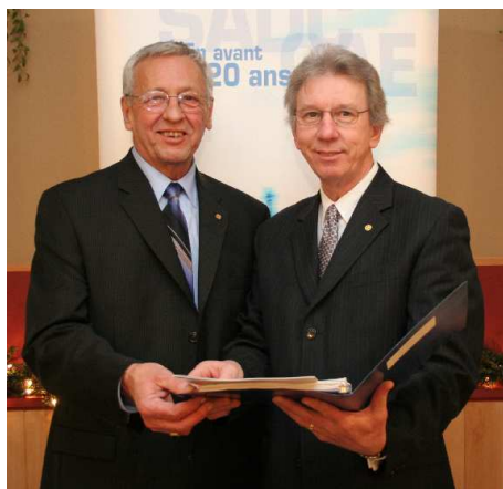
Gratien LeBel, président du Réseau des SADC du Québec et le ministre du Travail et ministre de l'Agence de Développement économique Canada, l'honorable Jean-Pierre Blackburn.

Cette dernière, a permis en neuf ans de créer 3 533 entreprises par des jeunes de 35 ans et moins. De plus, le programme d'emplois pour les étudiants permet d'offrir près de 130 emplois par année à des jeunes qui veulent s'installer en région.