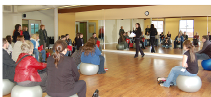
Visite chez Énergie Cardio