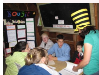
Travail en équipe

Ce camp, qui forme des jeunes à l'entrepreneuriat, rassemblera une trentaine de jeunes de différentes régions du Québec.