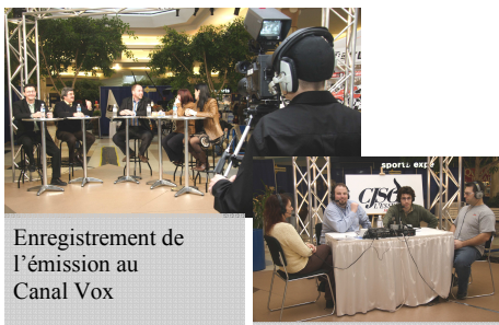
Enregistrement de l'émission au Canal Vox

Entrepreneurs en action a été présenté les 10 et 11 mars dernier aux Promenades de Sorel. Cette activité d'envergure visait à faire connaître à la population les nouveaux entrepreneurs de la région de Sorel-Tracy qui ont présenté leurs produits et services. De plus, cet événement a permis aux nombreux visiteurs d'en apprendre un peu plus sur ces entrepreneurs.