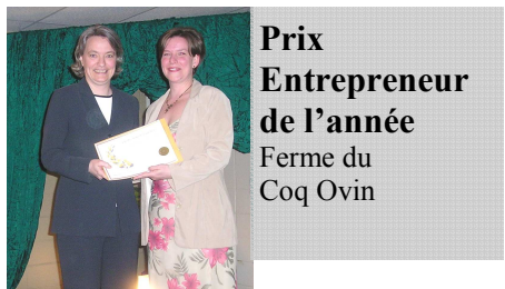
Prix Entrepreneur de l'année Ferme du Coq Ovin