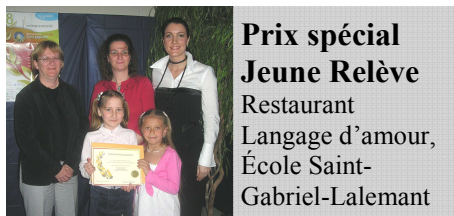
Prix spécial Jeune Relève Restaurant Langage d'amour, École Saint-Gabriel-Lalemant

L'entrepreneuriat, ça s'apprend quand on est jeune, dit-on. C'est pourquoi on y travaille avec les organismes locaux qui participent à la promotion de ce concours québécois soit le Carrefour jeunesse emploi, la SADC, le CLD, la Commission scolaire de Sorel-Tracy, le Centre de formation professionnelle et le Cégep de Sorel-Tracy, de même que Infotek Logiform. La SADC était heureuse de participer à la remise de prix dans les catégories suivantes :