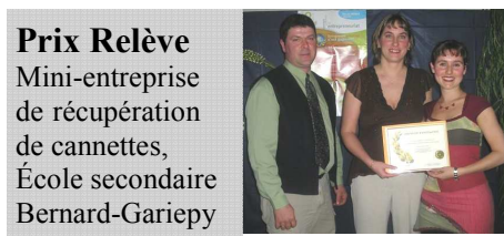
Prix Relève Mini-entreprise de récupération de cannettes, École secondaire Bernard-Gariepy