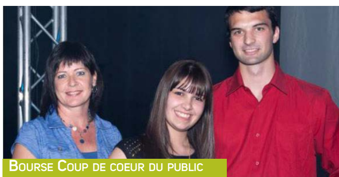
BOURSE COUP DE COEUR DU PUBLIC